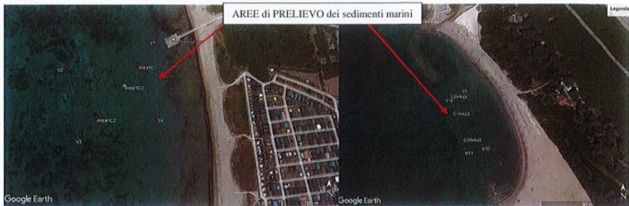
Allegato n.1 "Aree di intervento"

Intervento di spostamento dei sedimenti su fondali marini contigui individuati nel tratto di mare compreso tra il Fosso Circolare e il Fosso Mozzo nel comune di Rosignano Marittimo.