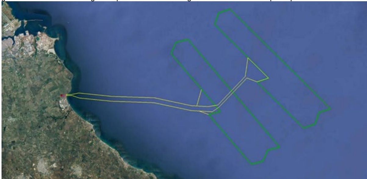
Figura 3-1: Vista del corridoio dei cavi marini 66kV

L'involuppo del corridoio comprendente tutti i cavi di trasmissione verso terra tra il parco eolico offshore e il punto di giunzione a terra ha una larghezza pari a 650m e una lunghezza di circa 30km dal punto più lontano dalla costa.