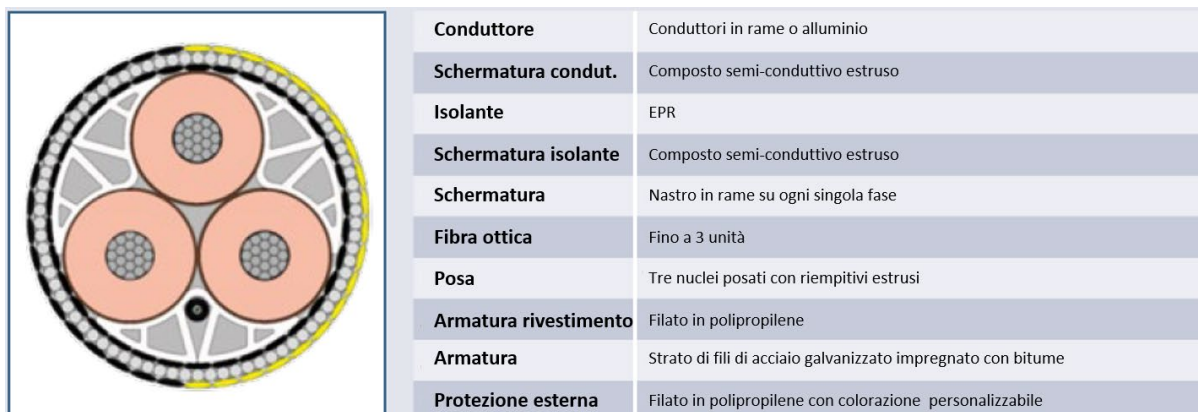
Figura 6-1: Esempio di cavo di collegamento a 66 kV