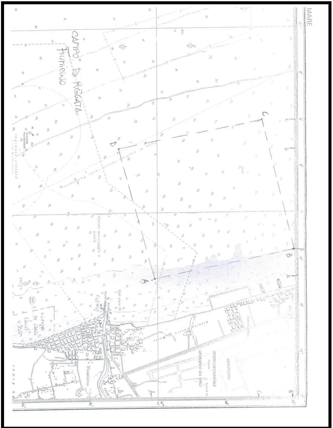
Planimetria allegata all'Ordinanza n.126/2018 del 01.10.2018.