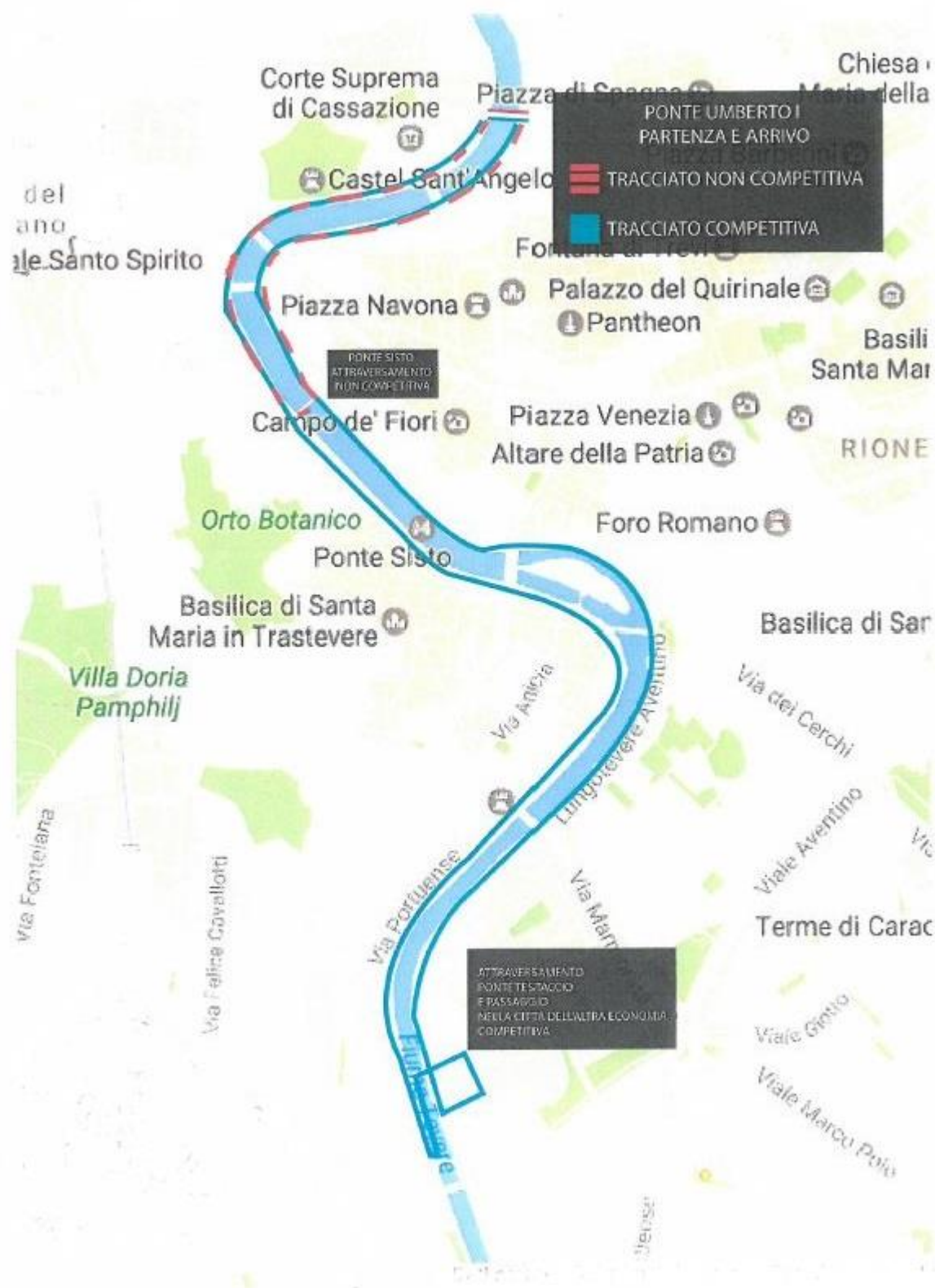
Planimetria allegata all'Ordinanza n. 47/2018 in data 27.04.2018.