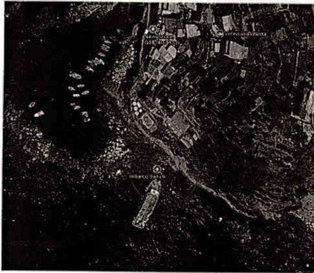
AREA APPRODO - RIOMAGGIORE