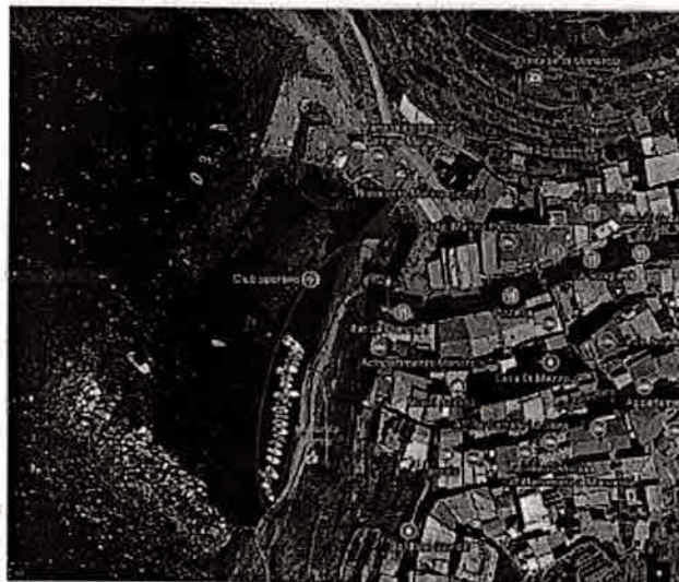
AREA APPRODO - MANAROLA